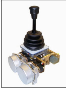
Abbildung: NS0 11 FN18DR 8P1.8P1 PW70.PW70